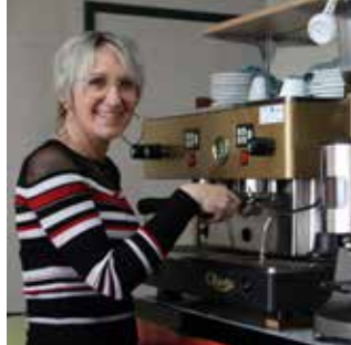
LA PETITE PAUSE Nueil-sur-Layon