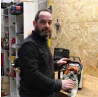
ATELIER DU LYS Vihiers