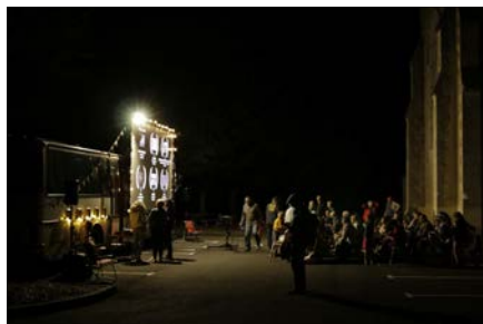
CINÉMA DE PLEIN AIR FESTIVAL LE PLEIN DE SUPER Vendredi 1 er septembre - Tancoigné