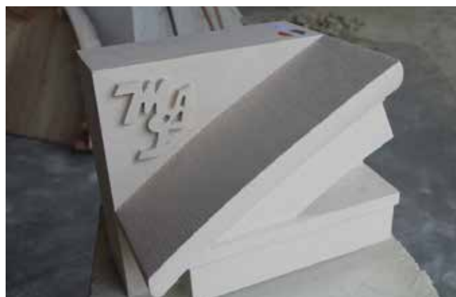
Pièce réalisée par Flavien Laroche pour sa participation au concours MAF (Un des Meilleurs Apprentis de France)

Son objectif pour l'avenir, est de rester dans cette entreprise en tant qu'ouvrier et d'envisager le concours MOF (un des Meilleurs Ouvriers de France).