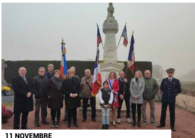
11 NOVEMBRE TIGNÉ - TANCOIGNÉ - LA FOSSE-DE-TIGNÉ