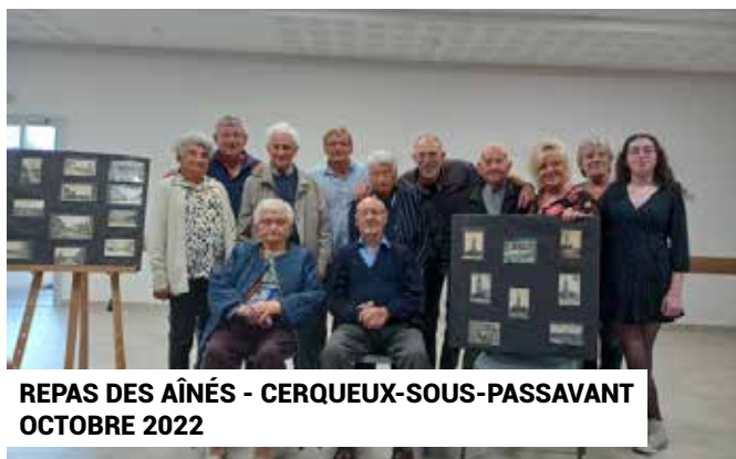
REPAS DES AÎNÉS - CERQUEUX-SOUS-PASSAVANT OCTOBRE 2022