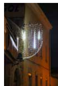
Les illuminations de Noël