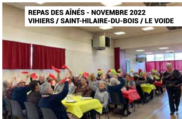
REPAS DES AÎNÉS - NOVEMBRE 2022 VIHIERS / SAINT-HILAIRE-DU-BOIS / LE VOIDE