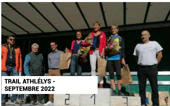
TRAIL ATHLÉLYS - SEPTEMBRE 2022