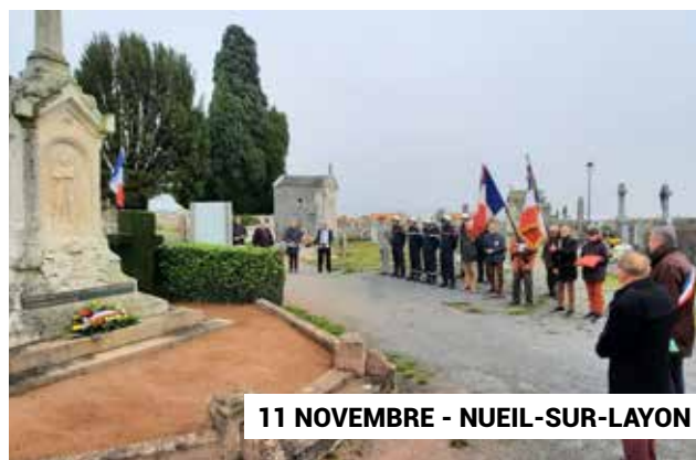
11 NOVEMBRE - NUEIL-SUR-LAYON