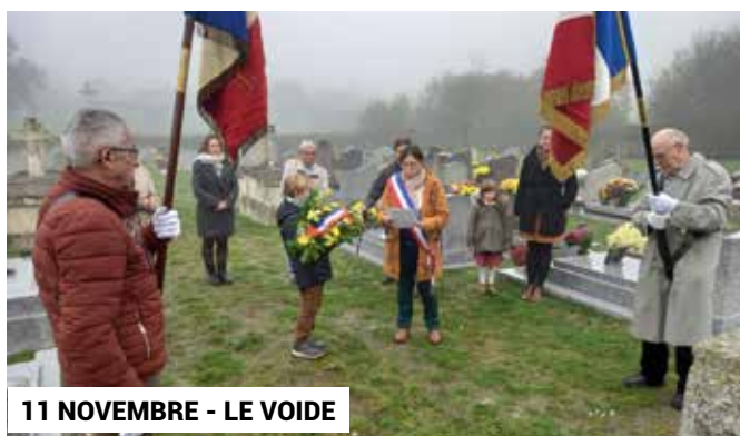
11 NOVEMBRE - LE VOIDE