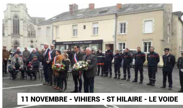
11 NOVEMBRE - VIHIERS - ST HILAIRE - LE VOIDE