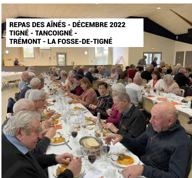
REPAS DES AÎNÉS - DÉCEMBRE 2022 TIGNÉ - TANCOIGNÉ - TRÉMONT - LA FOSSE-DE-TIGNÉ