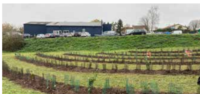
DÉCEMBRE - DEUXIÈME CESSON DE PLANTATION À L'ESCAPE DES GALOPINS À SAINT HILAIRE