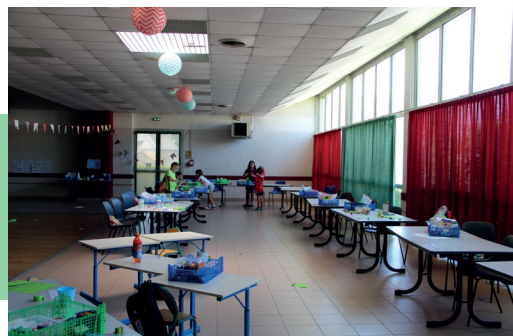
Accueil complémentaire - mai 2020

Comme tous les enfants ne pouvaient être accueillis à l'école, la commune a mis en place un dispositif d'accueil complémentaire dès le 14 mai 2020. Ce service a été organisé en partenariat avec le Centre socioculturel. Il était proposé pour tous les élèves de Lys Haut Layon, qu'ils soient scolarisés dans une école publique ou privée.