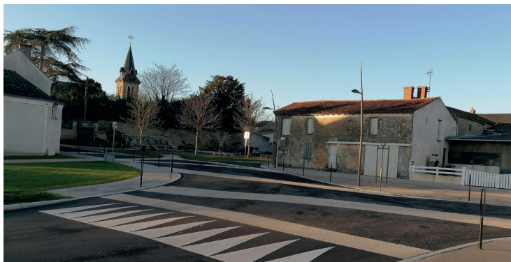
Aménagement du bourg de La Fosse-de-Tigné

Ces travaux permettent aux piétons d'accéder aux différents commerces ou autre sans obstacle tout en sécurisant le cheminement. Les trottoirs sont devenus accessibles aux Personnes à Mobilité Réduite.