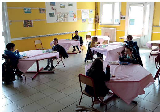
Rentrée scolaire 2020 - Restaurant scolaire

La situation sanitaire s'étant améliorée, le gouvernement a décidé d'un retour de tous les enfants à l'école le 22 juin 2020 . Le protocole sanitaire a été assoupli. Cependant, il restait des contraintes de distance entre les enfants et/ou adultes, des exigences fortes en termes d'hygiène des locaux. La difficulté a consisté à accueillir tous les enfants avec des consignes sanitaires encore importantes malgré l'allègement par rapport au mois de mai.