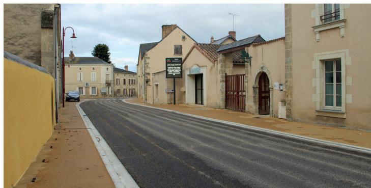
Aménagement du bourg de Tigné

Les bourgs de Tigné et La Fosse-de-Tigné ont été réaménagés d'avril à octobre 2020 . Le but de ces travaux est de sécuriser, d'avoir une meilleure accessibilité, moins d'entretien et un bourg plus accueillant. La traversée des bourgs est désormais limitée à 30 km/h. Les stops ont été supprimés et remplacés par des priorités à droite, pour augmenter la vigilance des automobilistes. Sur les deux communes, des plateaux avec des coloris différents ont été installés pour jouer sur le visuel des automobilistes dans le but de faire ralentir.