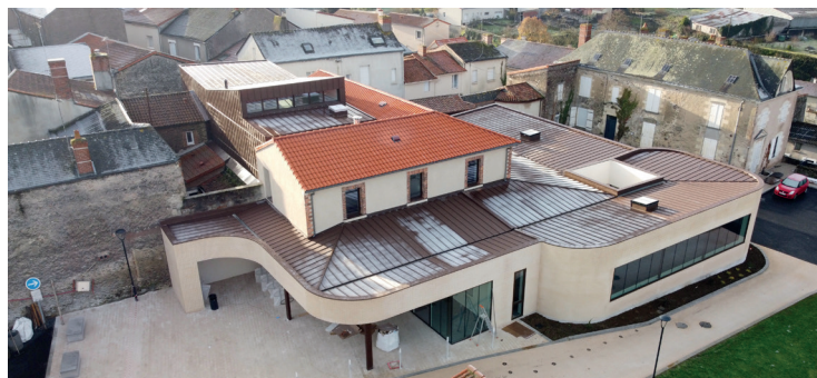
Daniel TURPAUD - Société MMC

Les travaux d'agrandissement de la bibliothèque/école de musique ont débuté le 15 juillet 2019. Les extérieurs pré-existants ont été conservés et valorisés au sein du lieu. Cet agrandissement représente désormais une superficie totale de 763 m 2 . Au rez-de-chaussée 359 m 2 sont dédiés aux livres et supports numériques auxquels s'ajoutent 100 m 2 de stockage pour les livres de l'Agglomération du Choletais et du Bibliopole. La bibliothèque de Vihiers devient donc une médiathèque tête de réseau. À l'étage 167m 2 sont consacrés à l'école de musique. Ce projet a été porté par l'Agence Grégoire Architectes et représente un coût de 1 750 000€ TTC subventionné à hauteur de 750 000€ par le Conseil Régional des Pays de la Loire.