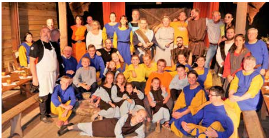
Dîner spectacle Vikings - 2018

L'association recherche également des bénévoles (acteurs, accessoiristes, figurants, costumiers, bricoleurs, etc.). N'hésitez pas à nous contacter pour rejoindre nos équipes : assoc_amilyls@yahoo.fr .