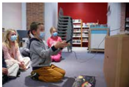
Nuits de la lecture - Médiathèques de Vihiers - 22 janvier 2022