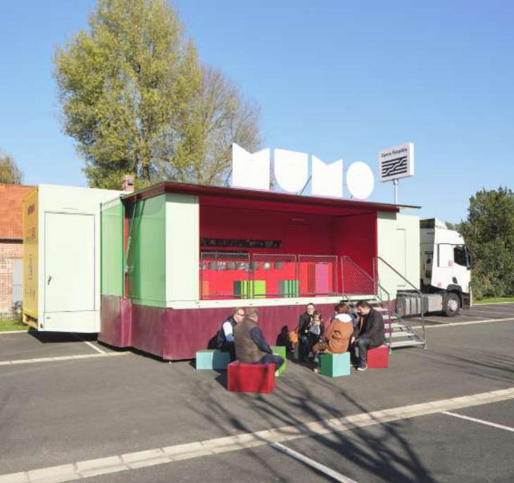
Le MuMo x Centre Pompidou conçu par Hérault Arnod Architectures et Krijn de Koning, artiste