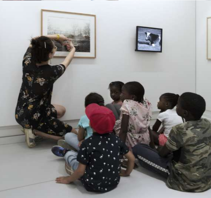
Le MuMo x Centre Pompidou conçu par Héroult. Amos Architectures et Krjvn de Koning, artiste