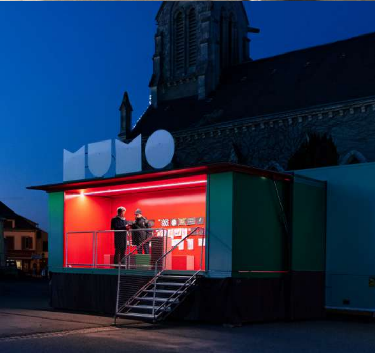
Le MuMo x Centre Pompidou conçu par Hérault Arnod Architectures et Krijn de Koning, artiste © Quentin Chevrier