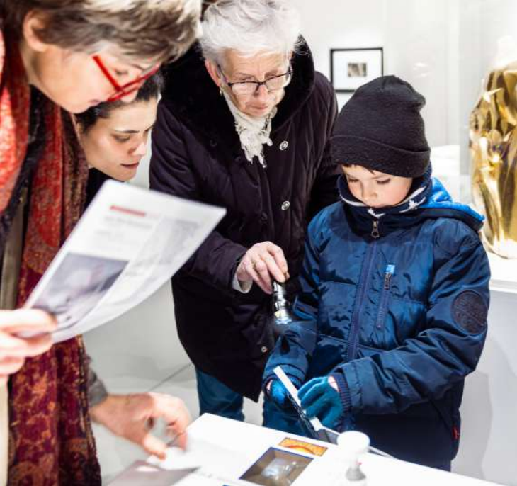
Le MuMo x Centre Pompidou conçu par Héroult. Amos Architectures et Krjvn de Koning, artiste © Quentin Chevrier